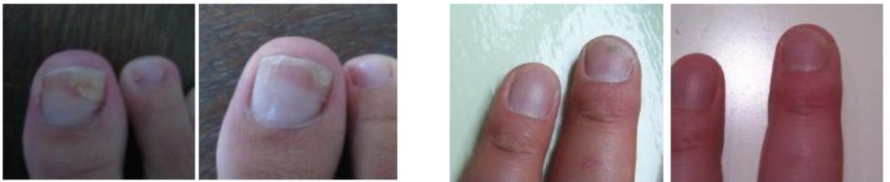
Fig. 2 Voorbeelden van behandeling van patiënten met schimmelnagels: voor de behandeling en na 4 weken MYCOSAN XL

Een klinische effect studie verricht bij 15 patiënten laat al een eerste verbetering zien na 10 dagen. Na 4 weken is bij 71% van de patiënten met een milde tot gemiddelde onychomycosis geen nagelschimmel meer waarneembaar. Bij de andere 28% is een afname van 84% van waarneembare trichophyton zichtbaar.